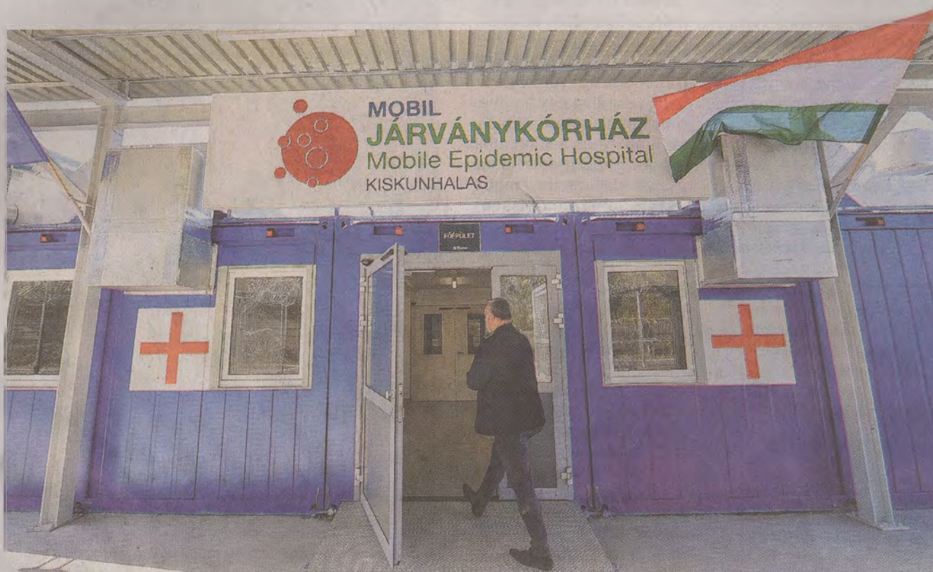
Azt híresztelik – valótlanul –, hogy nem lehet megnyitni a mobil járványkórházat, mert széthordták az eszközöket